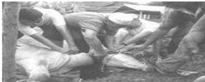
Gambar aktiviti sembelihan