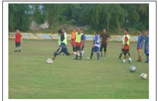
Latihan yang Berterusan