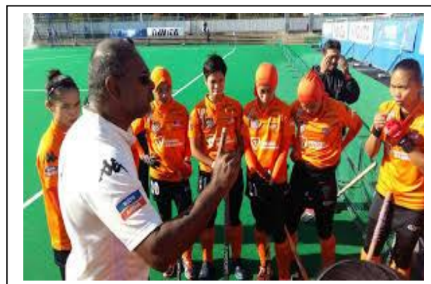
Jurulatih yang Mahir dan Berpengalaman