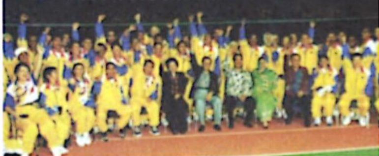
Atlet negara bersama-sama pemimpin negara semasa Sukan Komanwel 1996.