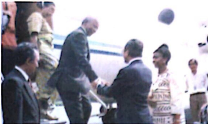
Lawatan Nelson Rolihlahla Mandela ke Malaysia pada tahun 1997..