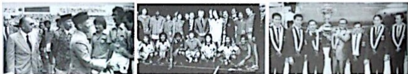
(Dari kiri) Pasukan hoki kebangsaan dalam pertandingan Hoki Piala Dunia 1975 diperkenalkan kepada Seri Paduka Baginda Yang di-Pertuan Agong V, Sultan Abdul Halim Mu'adzam Shah ibni Almarhum; Pasukan bola sepak kebangsaan berjaya melayakkan diri ke Sukan Olimpik Moscow pada tahun 1980 selepas mengalahkan Korea Selatan 2-1; Pasukan badminton Malaysia menjuarai Piala Thomas (1967).