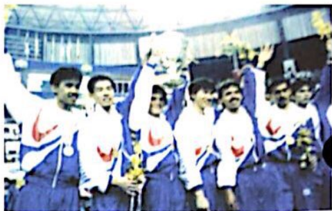
Pasukan badminton Malaysia yang menjuarai Piala Thomas pada tahun 1992.