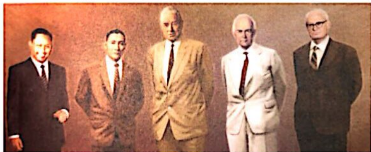
(Dari kin) Muhammad Ghazali Shafie, Wong Pow Nee, Lord Cobbold, Sir David Watherston dan Sir Anthony Abell