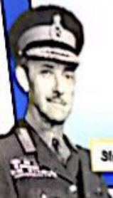
Sir Gerald Templer