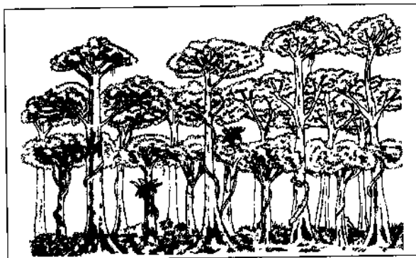
Gambar rajah 2

8) Gambarajah 2 menunjukkan profil tumbuh-tumbuhan semula jadi ?