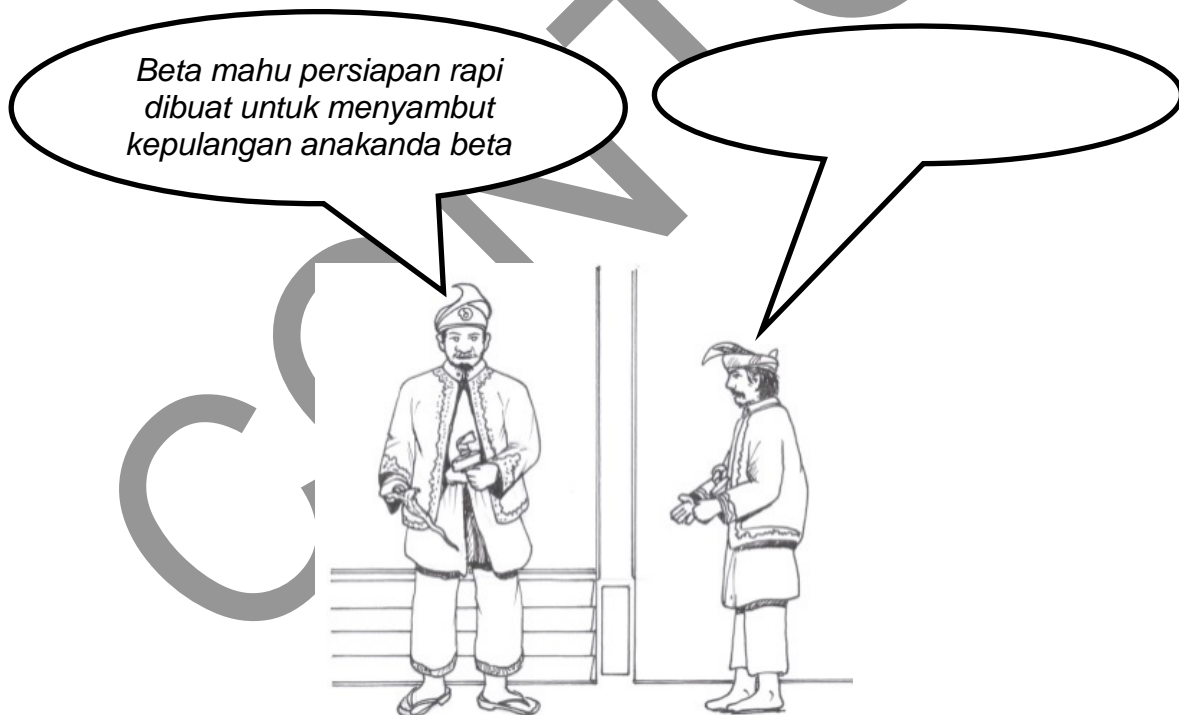
Sultan Mansor Syah

b. Tulis dialog yang sesuai bagi watak di bawah.